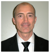
Le prospettive funzionali ed estetiche delle facciate ventilate Giancarlo Savini Cooperativa Ceramica d'Imola