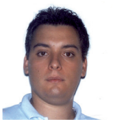
Sistemi di rivestimento a parete ventilata con lastre in agglomerato di cemento vibro compresso Alberto Stefanazzi Politecnico di Milano - BEST