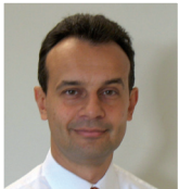
Oltre l'involucro edilizio tradizionale: l'innovazione parte dalla ricerca Paolo Valera Aderma Locatelli