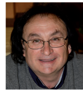
Un nuovo corso per la rinascita degli edifici Mario Belloni Nuovocorso