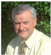
Ibridare tecnologie e linguaggio: involucri ventilati ad alta efficienza energetica Ezio Arlati Politecnico di Milano - BEST