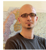
Il ruolo dell'isolamento nel sistema facciata ventilata. Prestazioni termoacustiche e di protezione incendio Luca Grugni Rockwool